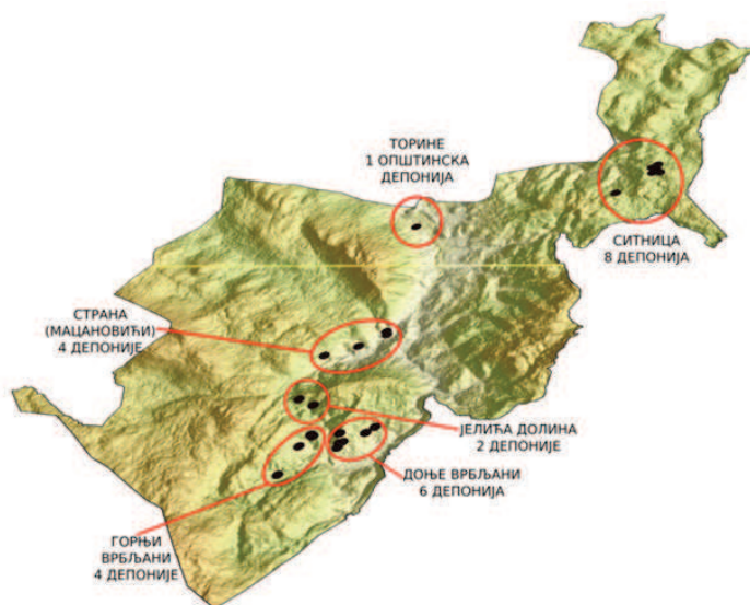
Сл. 1. Локације идентификованих депонија на територији општине Рибник Fig. 1. Locations of identified landfills in the territory of the municipality of Ribnik