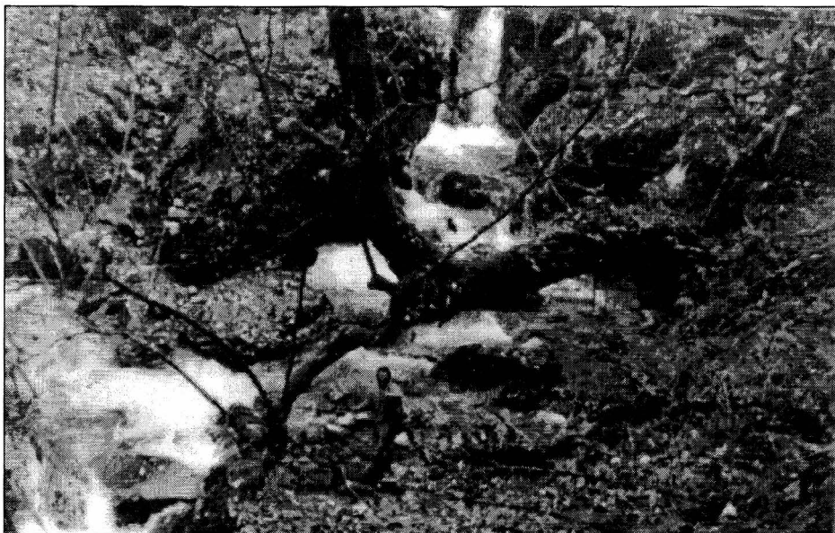
Слика број 1. - Планинска рјечица Студена

На подручју општине Теслић постоје многобројни стални водотоци као резултат већег притоца воде у ријечна корита од њеног укупног губљења. Количином воде и дужином воденог тока истичу се ријеке Велика Усора и Мала Усора које након што се споје низводно од Теслића чине ријеку Усору. Ту је и Мала Укриница која одводњава мањи дио територије општине Теслић. Ови водотоци су према Уредби и категоризацији водотока бивше Републике БиХ сврстани у прву и другу класу. Воде ових класа су довољно чисте да би се могле искористити за купање и спортове на води, затим за пиће (без већих уређаја за пречишћавање) и живот племенитих врста рибе као што су нпр. пастрмке и младице. Осим тога, притоке горњег дијела Велике Усоре карактеристичне су и по куриозитетним природним појавама везаним за водопаде и слапове.