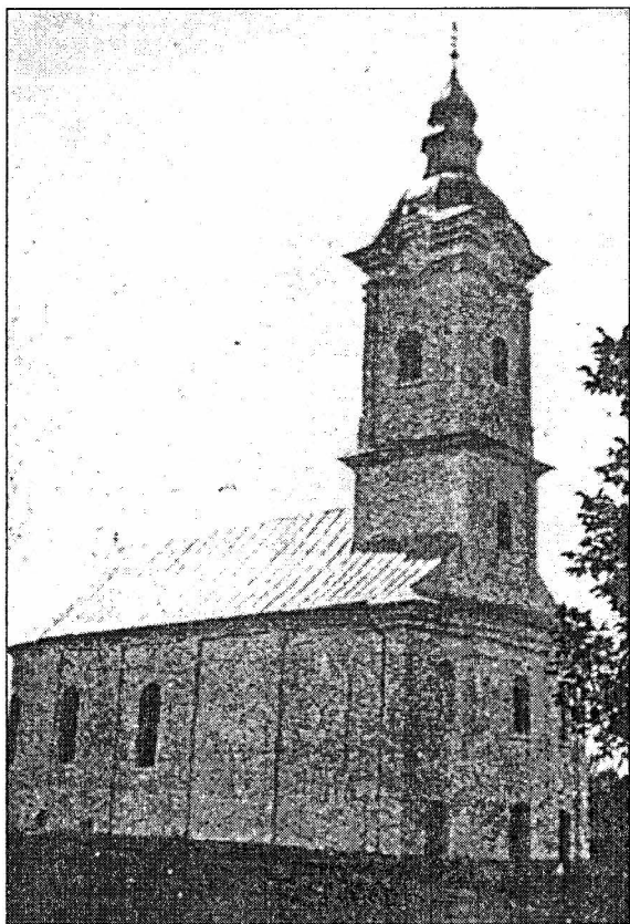
Сл. - Црква Св. Петра и Павла у бившој резиденцији северинског епископа; саграђена 1770. а обнављана 1879 и 1895.

Миром на ушћу ријеке Житве 1606. године Аустрија се изједначила са турском, јер више не мора плаћати данак турском султану, иако је изгубила два гранична подручја у Мађарској: Нађ-Кањижу код Драве и град Ђер на путу према Братислави и Бечу. Словинска-Вараждинска-Виндска крајина тим миром је добила за сусједа Турску и са сјевера, а не само са истока као до тада (3,72). Нова граница између два велика царства први пут је тачно одређена мировним уговором. То је уствари био широк простор између утврда-чардака