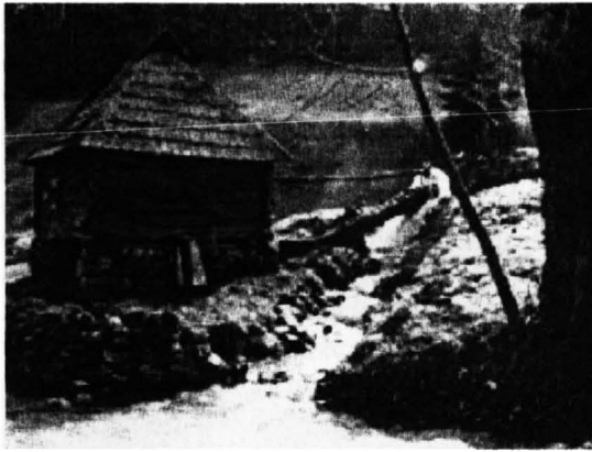
Слика 5. Воденица на ријеци Лука

Простор Власенице са окружењем, условно речено, има олакшавајућу околност, јер као слабо привредно развијена средина није ишла у корак са брзом урбанизацијом, па је рурално становништво дуго задржало традиционалне начине привређивања и живљења на селу. Још увијек је значајан број сеоских кућа са старим стилем планинске сеоске архитектуре. Такве куће су углавном са каменим укопаним подрумима у основи, гдје је камен ручно клесан. Подруми су тако укопани како би чинили приземље гдје се живи и ради углавном у току дана и у којем се намјештај прилагођава тој функцији. Улазна врата су по правилу по висини и ширини мања од данашњих стандарда и окренута су према оној страни од које најмање дувају вјетрови. Изнад подрума се налазе собе са главним улазом са супротне стране од улаза у подрум. Због нагнутости земљишта гдје је кућа постављена улаз у собе је са малом терасом директан са земље. Собе су саграђене од дрвених ручно резаних греда од смрче или јелике, које су са унутрашње стране поковане дрвеним шипкама, а затим покривене малтом и кречом. Неке куће се на исти начин малтају и са вањске стране. Дрвене греде се повезују са такозваним вјенчаницама, столицама и роговима за које се закивају летве и дрвени кров (шиндра). Због прилагођености климатским приликама кровови имају велики нагиб, типичан за планински стил градње. Овакве куће прате и остали грађевински садржаји за функционисање сеоског домаћинства.