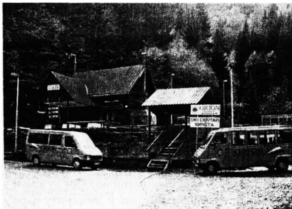
Слика 6. Етно-ресторан Јавор