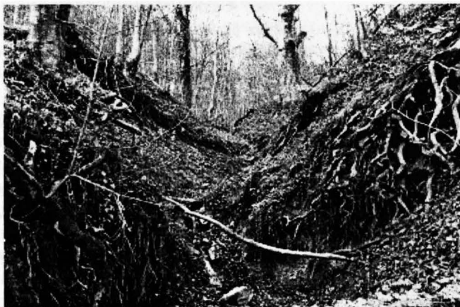
Слика 8. Ерозија у зони букових шума

Због тога се јавља потреба за еколошки чистим срединама, без буке, са чистим ваздухом и здравом храном.