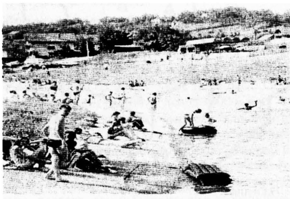
Слика 2. Спортско-рекреативни центар Језеро

Овдје постоје реалне могућности за изградњу разних спортско-рекреативних садржаја (терени за тенис, стони тенис, комбиновани терени за одбојку, кошарку и мали фудбал, бициклическе стазе, шеталишта...). У природној језерској акумулацији која се налази узводно од вјештачке акумулације могуће је направити еко-парк. Уз све поменуте садржаје треба имати у виду и потребу за угоститељским садржајима и стручним кадром за опслуживање спортско-рекреативног центра и сталном саобраћајном везом од града до језера.