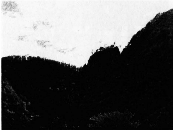
Слика 4. Дио Јавор планине, станиште дивокоза

Подручје општине Власенице је рељефно предиспонирано са брдско-планинским одликама, окомитим странама и великом заступљеношћу шумских и травних површина, кањонима ријека и кланцима, повољно је за развој ловног и риболовног туризма. Обиље шумских плодова, разноврсност и богатство травних површина, повољно је станиште за дивље животиње. Све то је условљено и педолошком основом земљишта. Педолошки састав земљишта зависи од геолошког матичног супстрата и уз међусобну комплементарност осталих био-педолошких фактора заступљен је са више типова земљишта.