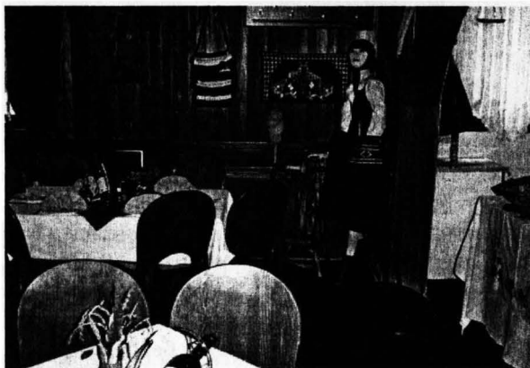
Слика 7. Унутрашњост етно- ресторана Јавор

Са становишта туристичке понуде и новитета у понуди могли би се издвојити и такозвани тематски ресторани у које савакако спадају и етно-ресторани. У оквиру овакве туристичко-угоститељске понуде организује се поставка ресторана за циљну клијентелу. Екстеријер и ентеријер ресторана мора бити прилагођен тематском смислу и циљу ресторана. Врло често у имену ресторана се наслућује и вид ресторана. Прилагођеност (тема) ресторана типује на психологију личности и носталгију за неком културом или пак жељом за упознавањем те културе. Такви ресторани су углавном: музејски етно-ресторани, музејски спортски ресторани, клубови књижевника и слично.