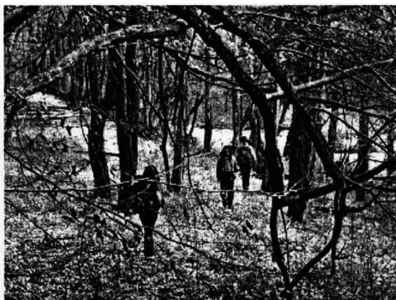
Слика 3. Планинарење-Дрињача

У даљњем развоју планинарења и алпинизма потребно је израдити туристичке карте са уцртаним планинарским маркираним стазама и свим туристичким детаљима које треба да садржи таква карта. Ради популаризације усклађен је календар са Републичким планинарским савезом, али тај календар треба прилагодити и са земљама у окружењу у којима овај вид туризма има дугу традицију. Планинари из Власенице су до сада учествовали у освајању више врхова у Европи (Мон Блан, Олимп, Дурмитор, Мусалу, Проклетије...). Да би овај вид туризма добио међународни карактер неопходно је да и планинари из других држава дођу и упознају наше планине.