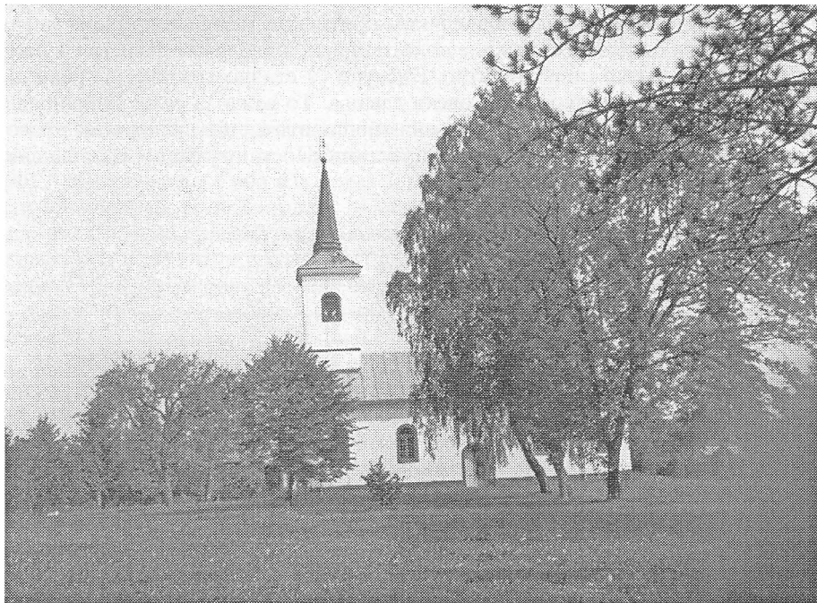
Сл. 2. Православна црква у Српској Капели (сада Нова Капела). Сликао инџ. Здравко Мојсал из Врбовца 1997. године. Црква је обновљена 1995. г. и освјетљена ноћу од г. Велика Севера.

1647. год. ливено у Грацу. Садашња црква из 1826. године на пољу "Клиса" усред села. Шеших је навео и имена свештеника од 1750. до 1825. године, када је он преузео парохију." (6,156). Као сигурно се може узети да је у "Влашкој Капили" и у 17. в. постојала православна дрвена црква. Црква је посвећена св. Георгију, а велики црквени сабор је за Велику Госпојину (28.8.).