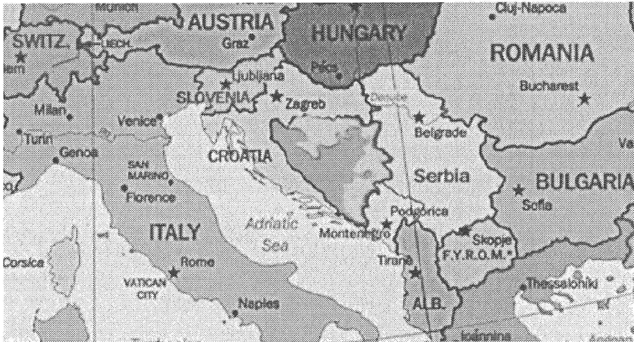
Сл. 1. Географски положај Републике Српске

Код оцене географског положаја Републике Српске као туристичке вредности мора се поћи од две чињенице: