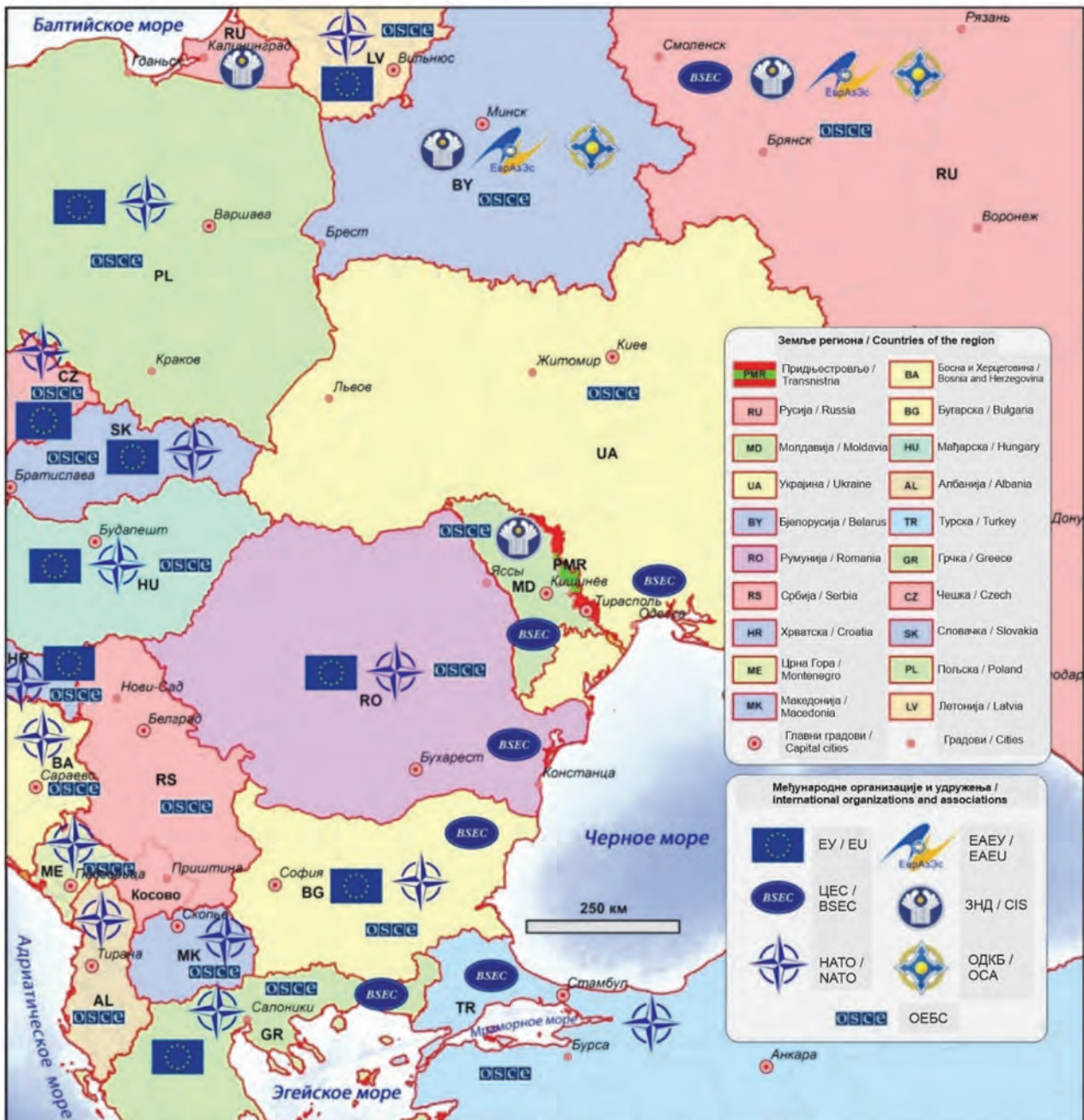
Сл. 1. Савремени геополитички положај Придњестровља Fig. 1. The modern geopolitical situation of Transnistria

Украјина је прије поменутих догађаја била један од главних спољно-економских партнера Придњестровља. Она је била држава гарант у преговарачком процесу за нормализацију односа са Молдавијом, а украјински војни посматрачи учествовали су у мировним мисијама на обалама ријеке Дњестар. Поред тога, успостављене су везе